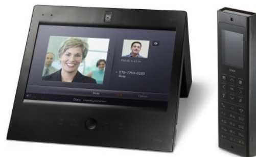
Медиафон WAVE Home со встроенным голосовым и видео ПО SPiRiT